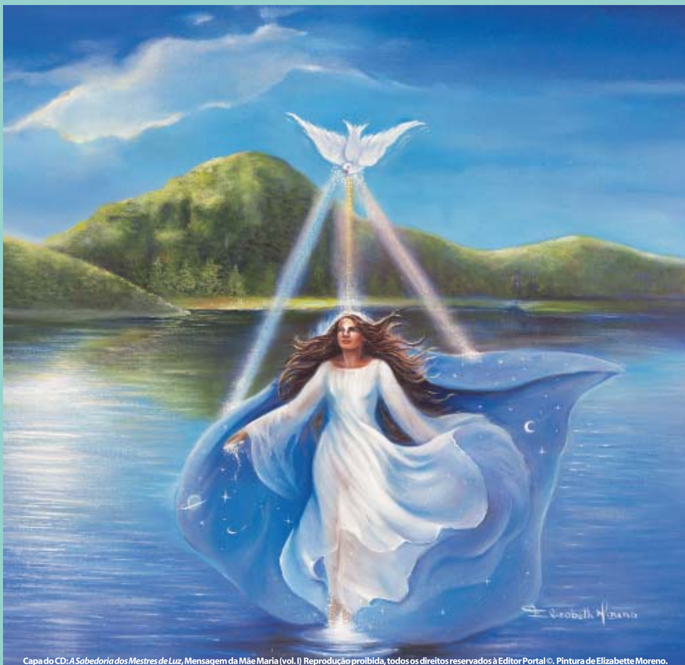
Capa do CD: A Sabedoria dos Mestres de Luz, Mensagem da Mãe Maria (vol. I) Reprodução proibida, todos os direitos reservados à Editor Portal ©. Pintura de Elizabete Moreno.