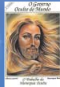
O GOVERNO OCULTO DO MUNDO - O Trabalho da Hierarquia Oculta.- Henrique Rosa

JORNAL DE CIÊNCIAS ESOTÉRICAS distribuição gratuita